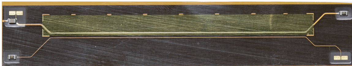
クロストーク評価サンプル FPC

信越ポリマー(株)製ノイズ抑制フィルム「SPINPEDA®(スピンピーダ)」をカバー層に組み込んだ FPC です。